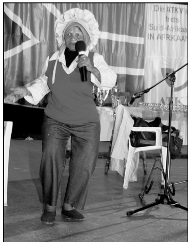
Ouma Grietjie het luister aan die kompetisie verleen.

Vanjaar was daar nog groter belangstelling in die kompetisie. Die