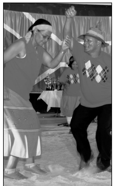
Só is daar verlede jaar laat waai in die rieldans-kompetisie in die Paarl.